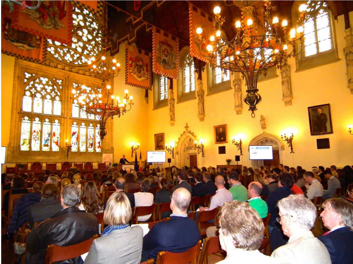
Meer dan 220 bezoekers afkomstig uit 26 landen kwamen naar Brugge om in het "Provinciaal Hof" de voeding en training van het toppaard te bespreken.